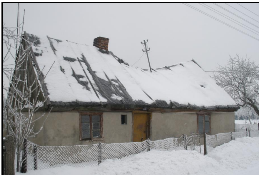
Fot. 4 Widok na budynek nr 7