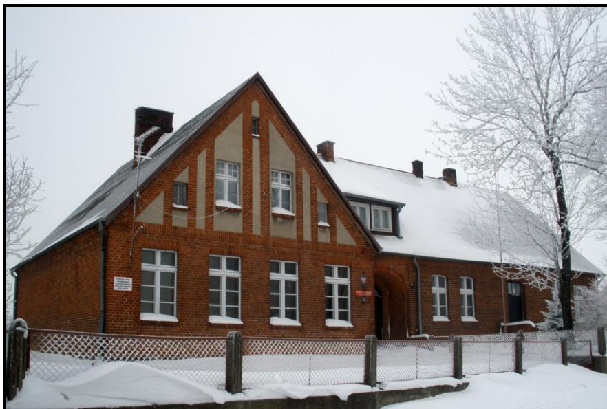
Fot. 3 Budynek dawnej szkoły podstawowej