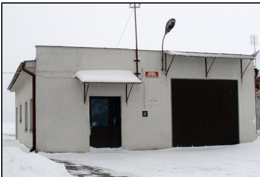
Fot. 7 Siedziba OSP

W Wielkich Bałówkach prężnie działają zorganizowane grupy mieszkańców tzn. Koło Gospodyń Wiejskich z ponad 50-letnią tradycją liczące 22 panie, Ochotnicza Straż Pożarna licząca 32 ochotników, przy OSP działa również Młodzieżowa Drużyna Pożarnicza (12 członków).