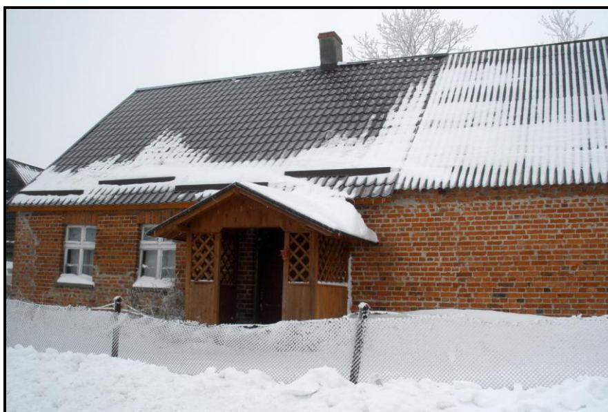
Fot. 5 Widok na budynek nr 16