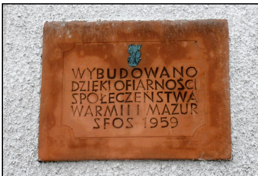
Fot. 1 Tablica upamiętniająca budowę świetlicy wiejskiej