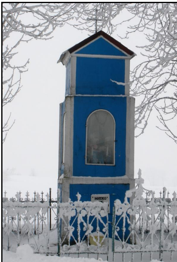
Fot. 2 Kapliczka Matki Boskiej

Do najważniejszych problemów wsi należy bezrobocie lokalnej społeczności oraz bieda. Pierwszy problem, czyli bezrobocie dotyka głównie ludzi młodych. Często po skończeniu szkoły bezskutecznie poszukują pracy, czasami nawet przez kilka lat. Niejednokrotnie wyjeżdżają ze swojej miejscowości do dużych miast, aby tam znaleźć pracę. Jest to przyczyną wyludnienia się wsi oraz starzenia się jej mieszkańców.