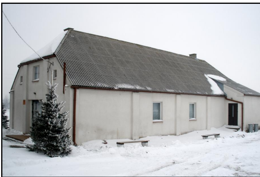
Fot. 6 Świetlica wiejska

W Wielkich Bałówkach znajduje się budynek dawnej szkoły podstawowej z boiskiem szkolnym, remiza strażacka, świetlica wiejska, figurka Matki Boskiej, plac zabaw dla dzieci, dwa sklepy spożywczo-przemysłowe w tym jeden Gminnej Spółdzielni „Samopomoc Chłopska” Kurzętnik z siedzibą w Marzęcicach. We wsi nie ma kościoła, mieszkańcy należą do parafii Tereszewo. Na zachodnim skraju miejscowości znajduje się poniemiecki cmentarz z początku XX wieku, który kryje szczątki Niemców mieszkających niegdyś w Wielkich Bałówkach.