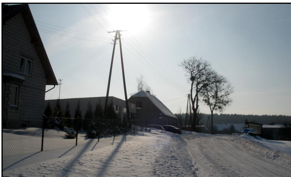
Fot. 2 Widok na centrum wsi

Wieś tworzy typ osady z rozproszoną zabudową skoncentrowaną przy głównej drodze przelotowej. Budynki położone w centrum mają estetyczny wygląd, w większości nie są to nowe budynki, ale stosunkowo zadbane.