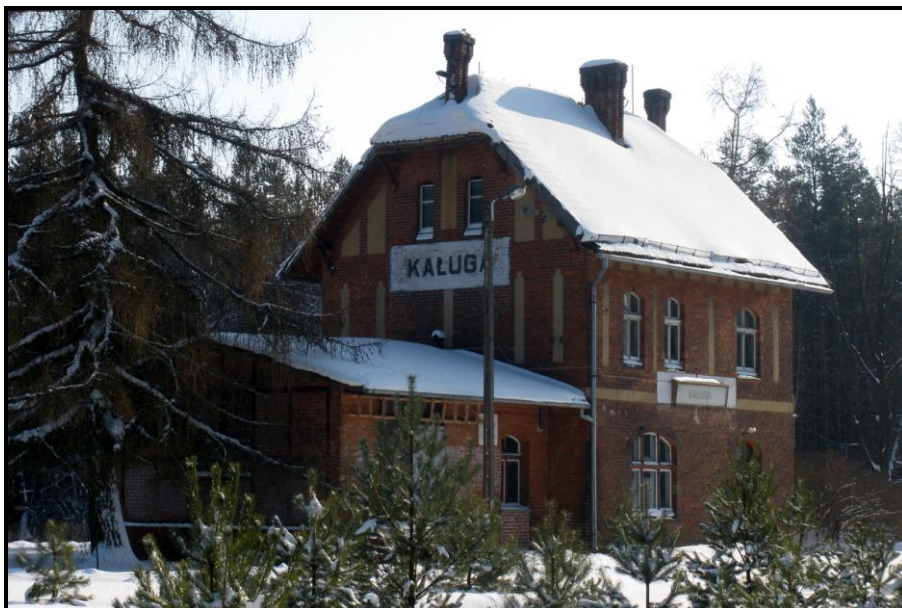
Fot. 5 Budynek dawnej stacji kolejowej Kaługa

Ponadto na północnym i południowym skraju wsi znajdują się dwie przydrożne kapliczki. Kapliczka Matki Boskiej usytuowana na północnym krańcu wsi powstała w latach 20-tych XX wieku, natomiast druga stojąca przy lesie została zbudowana z cegieł pochodzących z Klasztoru w Łąkach koło Nowego Miasta Lubawskiego w 1881 roku.