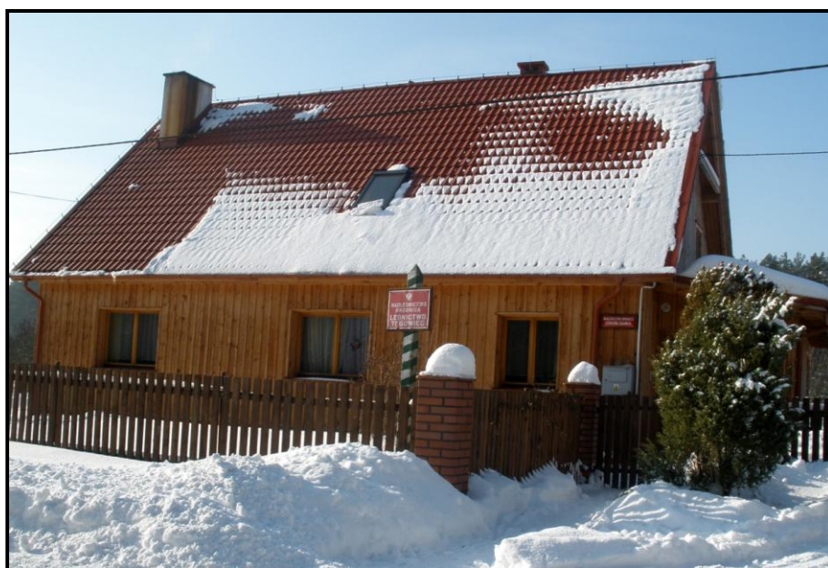
Fot. 8 Widok na leśniczówkę