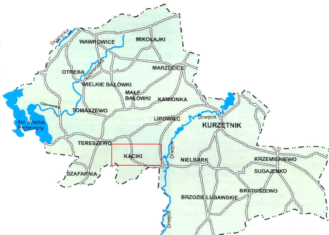
Rys. 2 Lokalizacja projektu w układzie administracyjnym gminy Kurzętnik