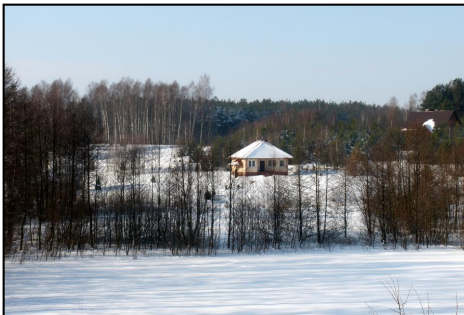
Fot. 1 Widok na tereny rekreacyjne miejscowości

funkcję rekreacyjno-turystyczną. Dodatkowo w niewielkiej odległości od tej miejscowości zlokalizowany jest Ośrodek Wypoczynkowy „Partęczyny” nad Jeziorem Wielkie Partęczyny, do którego chętnie przyjeżdżają turyści z terenu całej Polski. Kącki i okolice to bardzo atrakcyjne miejsce posiadające liczne walory przyrodnicze i krajobrazowe. Coraz częściej miejscowość staje się interesującym miejscem do osiedlania się. Ze względu na duże walory rekreacyjno-wypoczynkowe okolicznych lasów i jezior, Kącki są ciekawym miejscem do rozwoju agroturystyki.