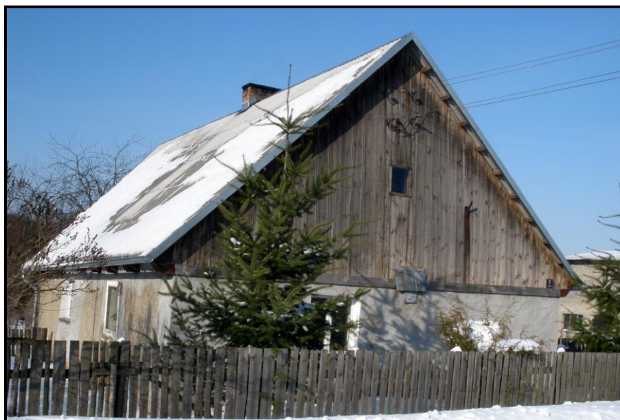
Fot. 4 Widok na budynek mieszkalny nr 2