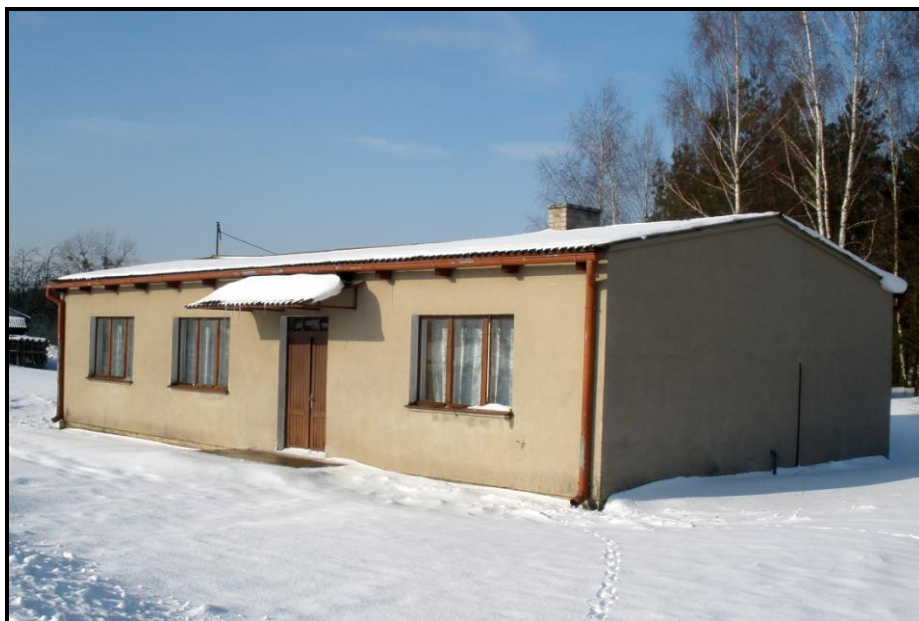
Fot. 7 Świetlica wiejska w Kącikach

W Kącikach znajduje się świetlica wiejska, leśniczówka (Nadleśnictwo Brodnica Leśnictwo Tęgowiec) oraz jeden sklep spożywczo-przemysłowy Gminnej Spółdzielni „Samopomoc Chłopska” Kurzętnik z siedzibą w Marzęcicach. Aktualnie w miejscowości brak jest zarejestrowanych podmiotów gospodarczych.