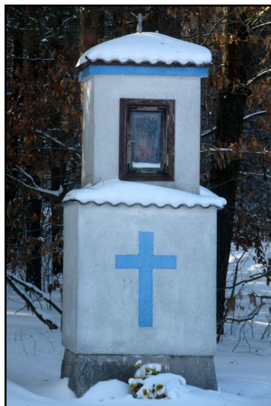
Fot. 6 Kapliczka Matki Boskiej oraz kapliczka przy lesie