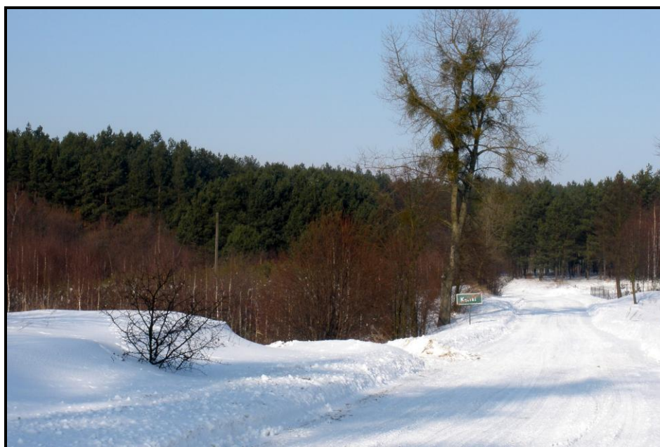
Fot. 3 Lasy otaczające miejscowość Kąciki

Środowisko naturalne Kącików należy do mało zanieczyszczonych. Na terenie wsi, ani w jej pobliżu nie ma dużych zakładów, które by zatruwały środowisko. Praktycznie jedynym źródłem zanieczyszczenia jest rolnictwo, które stosując różnego rodzaju nawozy sztuczne oraz środki ochrony roślin powoduje zanieczyszczenie wód gruntowych oraz powierzchniowych. Obszar ten odznacza się wysokimi walorami przyrodniczymi i krajobrazowymi, ponieważ 68,35% (444,4969 ha) powierzchni całej miejscowości zajmują lasy.