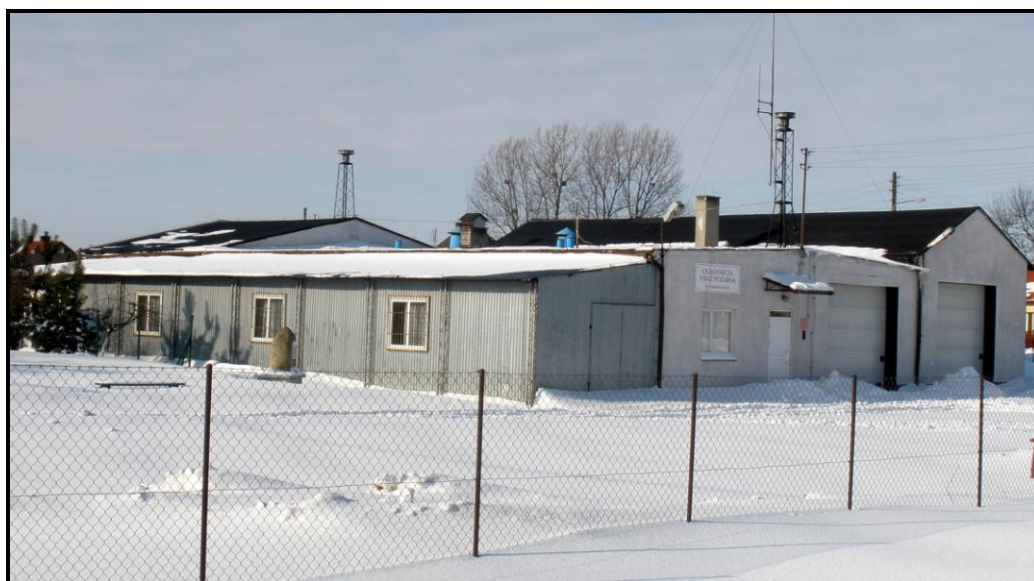
Fot. 7 Siedziba OSP ze świetlicą wiejską

W Marzęcicach działają zorganizowane grupy mieszkańców tzn. Koło Gospodyń Wiejskich z ponad 40-letnią tradycją liczące 32 pań, Ochotnicza Straż Pożarna licząca 58 ochotników, przy OSP działa również Młodzieżowa Drużyna Pożarnicza (9 członków).