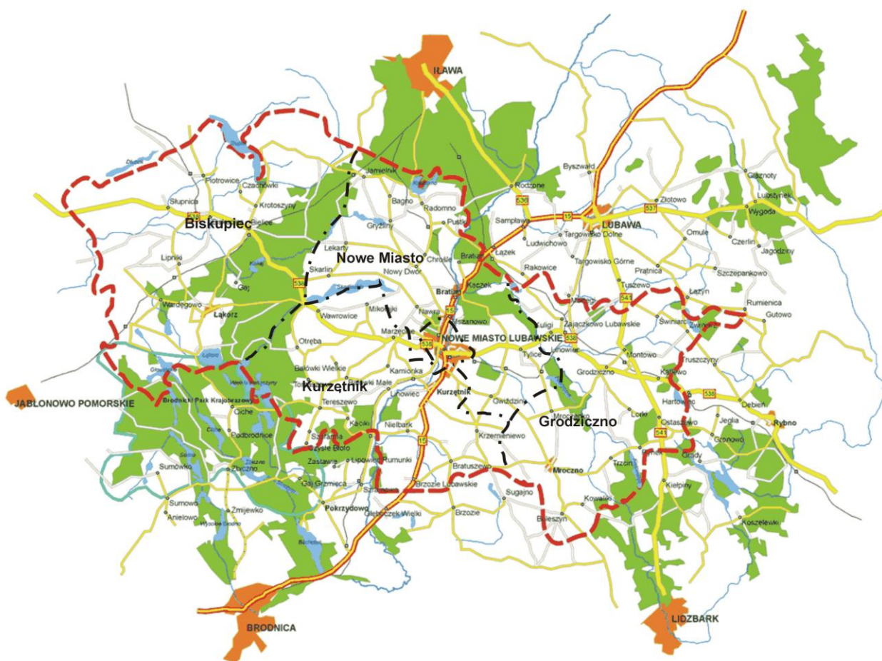
Rys. 1 Układ administracyjny powiatu nowomiejskiego

Marzęcice położone są na północno-wschodnim skraju gminy Kurzętnik. Miejscowość ta sąsiaduje od północy z wsią Mikołajki, od południa z wsią Kamionka, natomiast od południowo-zachodu z wsią Małe Bałówki. Od strony wschodniej wieś Marzęcice graniczy z Nowym Miastem Lubawskim. Wszystkie miejscowości, poza Nowym Miastem Lubawskim, sąsiadujące z Marzęcicami leżą w granicach administracyjnych gminy Kurzętnik. Wieś położona jest w sąsiedztwie drogi wojewódzkiej nr 538 relacji Radzyń Chełmiński-Rozdroże, która jest głównym ciągiem komunikacji samochodowej wschód-zachód.