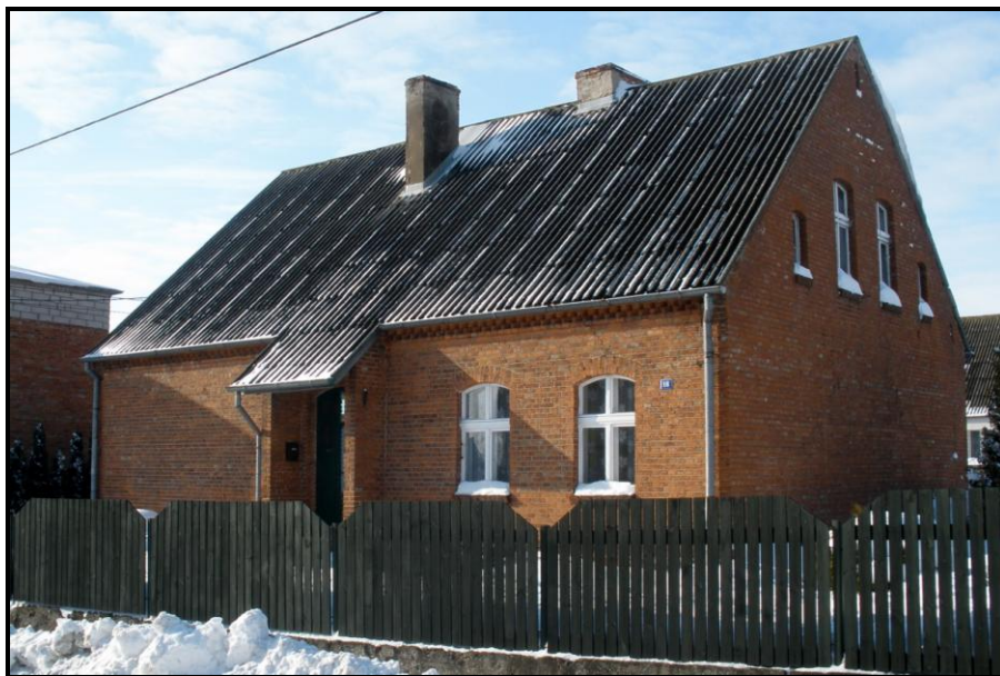
Fot. 3 Widok na dawną szkołę podstawową