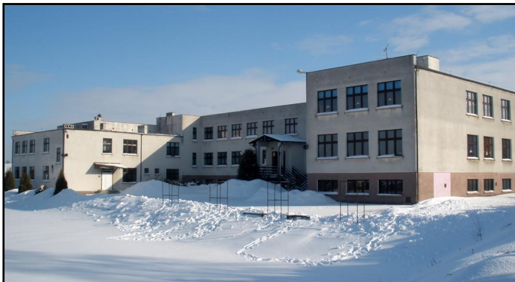
Fot. 5 Budynek Zespołu Szkół w Marzęcicach