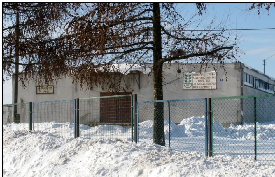
Fot. 2 Gminna Spółdzielnia „Samopomoc Chłopska” w Kurzętniku z/s w Marzęcicach