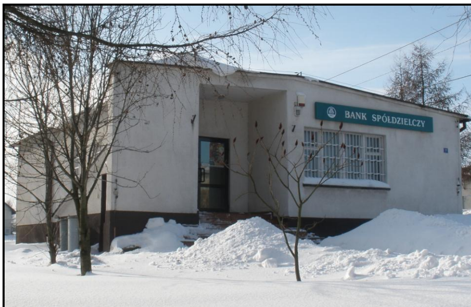
Fot. 1 Budynek Banku Spółdzielczego w Marzęcicach

Ważne miejsce w życiu lokalnej społeczności Marzęcic i sąsiednich wsi zajmuje Bank Spółdzielczy. W latach 1946-1960 w Marzęcicach mieścił się punkt kasowy S.O.P. z Nowego Miasta, od 1961 roku samodzielna kasa spółdzielcza, a od roku 1971 Bank Spółdzielczy w Kurzętniku z siedzibą w Marzęcicach. Obecnie Oddział Operacyjny Banku Spółdzielczego w Brodnicy z siedzibą w Marzęcicach.