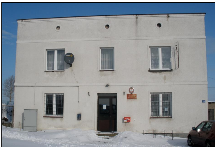
Fot. 6 Widok na Punkt Nadawczy Poczty Polskiej w Marzęcicach

Obecnie w tej miejscowości działa kilka większych zakładów: stolarski „AM-MEBLE”, tartak, kwaciarnia „Magdalenka”, pizzeria „al Vulcano”, P.H.U. „Auto-Gaz”, dwie firmy produkujące płytki ceramiczne oraz wielu lokalnych przedsiębiorców m.in.: usługi hydrauliczne, budowlane, pielęgniarstwo, firma transportowa oraz sklepy spożywczo-przemysłowe.