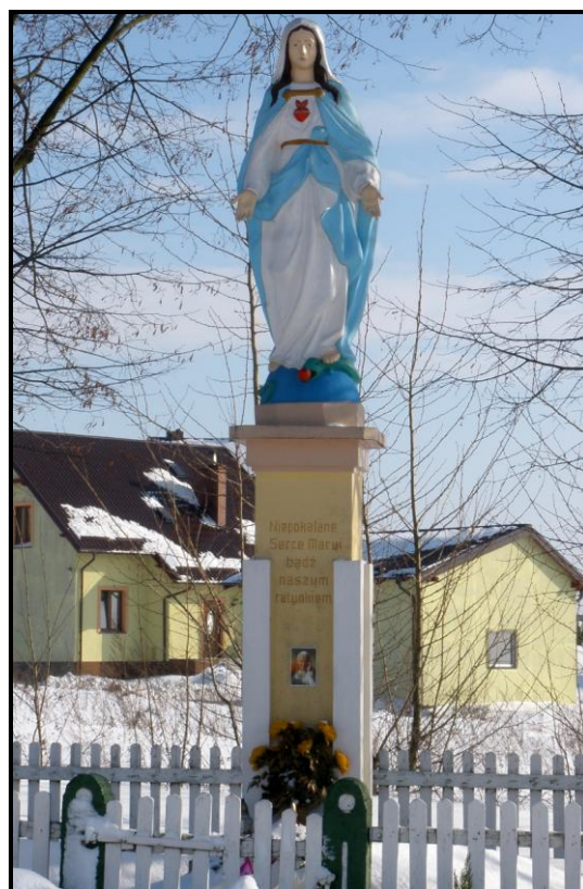
Fot. 4 Kapliczka Chrystusa Króla i Figura Niepokalanego Serca Maryi