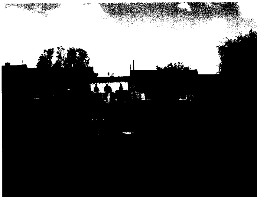
Fot. 4 Rynek wraz z zabudową