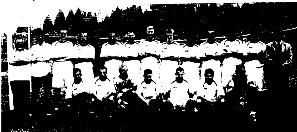
Fot. 7 Klub Sportowy ZAMEK

Już od 12 lat Klub organizuje corocznie Błyskawiczny Turniej Piłki Nożnej o Puchar Wójta Gminy Kurzętnik, w którym biorą udział najlepsze drużyny z regionu (III i IV liga).