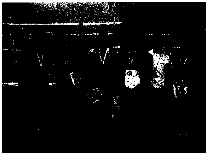
Fot. 9 Zawodnicy sekcji Kick-boxingu na Międzynarodowym Pucharze Polski Polish Open 2008 Węgrów

W 2001 r. Klub powiększył się o kolejną sekcję Kick-boxingu, która zdobyła już kilka medali Mistrzostw Polski. Klub corocznie organizuje Eliminacje Strefy północnej do Mistrzostw Polski w Kick-boxing wersji light-contact.