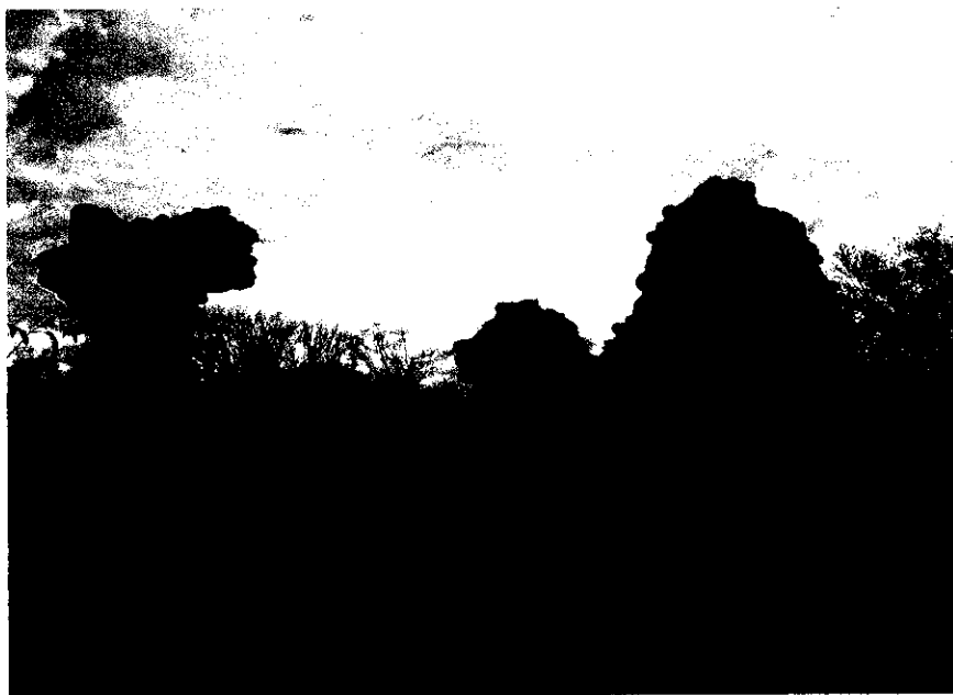
Fot. 1 Ruiny zamku Biskupów Chełmińskich

Pierwsza wzmianka o Kurzętniku, zwanym wówczas Kurnikiem pochodzi z 1291 r. Jest to dokument o nadaniu ziemi, wokół góry Kurnik kapitulie chełmińskiej, należącej do zakonu Krzyżackiego. Wkrótce na wzniesieniu wybudowany został zamek, w którym urzędował burgrabia wyznaczany przez kanoników z Chełmna. Miasto zostało lokowane w 1330r. na prawie chełmińskim, a jego wznoszeniem zajęli się osadnicy niemieccy.