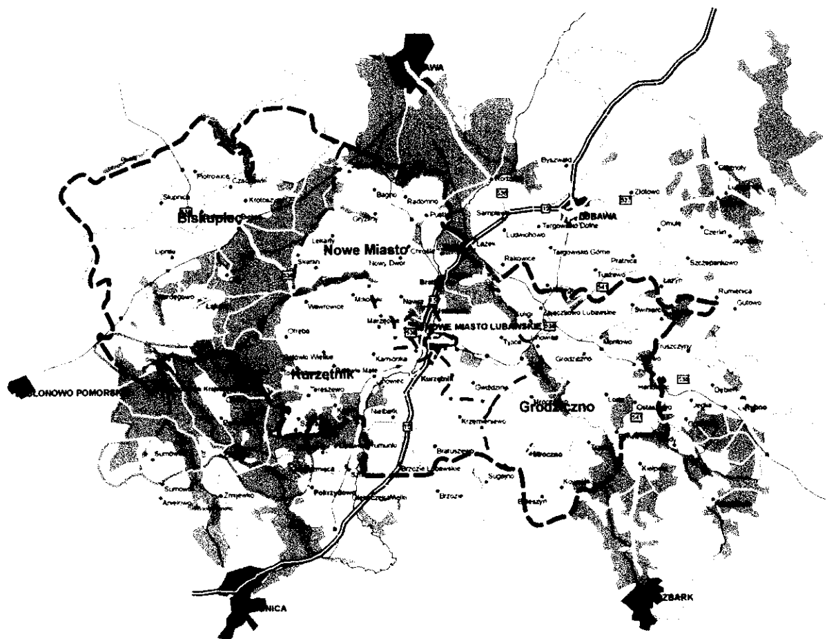
Rys. 1 Układ administracyjny powiatu nowomiejskiego

Kurzętnik usytuowany jest w dolinie Drwęcy, rzeki czystej, atrakcyjnej dla turystów i wędkarzy. Wieś położona jest w sąsiedztwie drogi krajowej nr 15 Toruń-Olsztyn, która jest głównym ciągiem komunikacji samochodowej wschód-zachód.