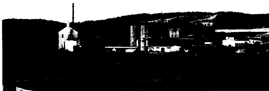
Fot. 2 Widok Przedsiębiorstwa Produkcji Betonów „Prefabet-Kurzętnik”

Na terenie wsi, znajduje się kilka zakładów przemysłowych i usługowych m.in. Przedsiębiorstwo Przemysłu Betonów „Prefabet-Kurzętnik”, PPU „Alsybet” Sp. z o.o., „WZB Polska” Sp. z o.o., „Expom” S.A. - produkujący konstrukcje stalowe i spawane części maszyn oraz zbiorniki, hale stalowe, maszty i urządzenia ochrony środowiska, „Lawapol” Sp. z o.o. - oferujący stalowe konstrukcje do produkcji maszyn i budownictwa. Położenie tych zakładów jak również niewielka liczba gospodarstw rolnych, nie wywierają znacznego, negatywnego wpływu na środowisko naturalne.