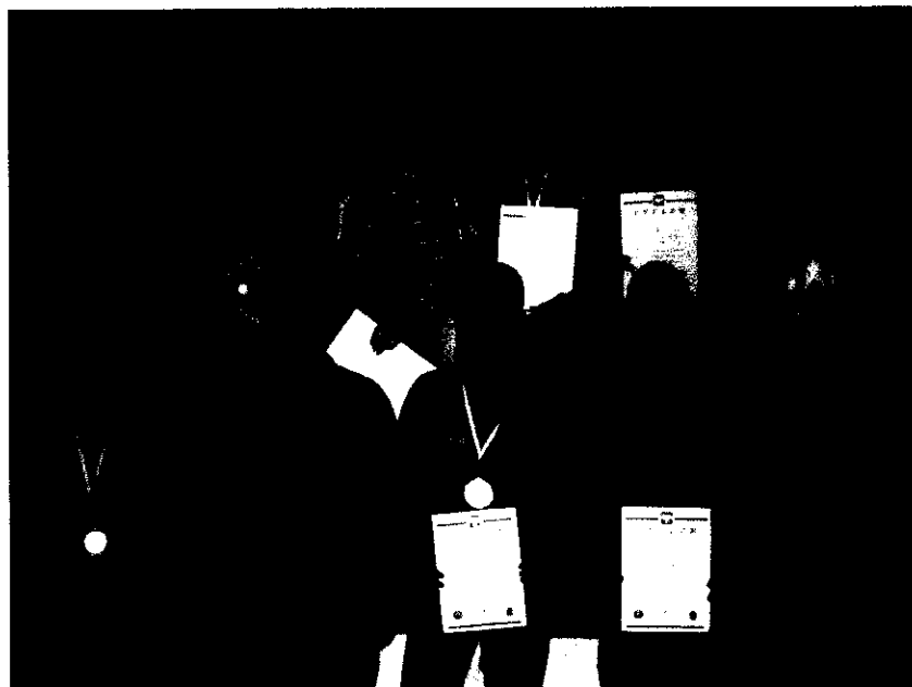
Fot. 8 Sekcja trójboju siłowego na Mistrzostwach Polski Juniorów do lat 18 Warszawa 2008

turniej w Trójboju Siłowym o Puchar Wójta Gminy Kurzętnik (od 16 lat) i Otwarte Mistrzostwa woj. warmińsko-mazurskiego w Dwuboju Siłowym.