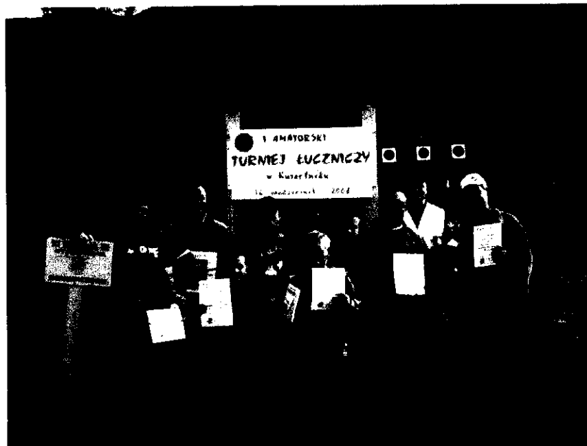
Fot. 10 Uczestnicy I Amatorskiego Turnieju łuczniczego w Kurzętniku (2008)

wesprzeć sekcję i umożliwić jej rozwój oraz promocję zakupiła maty łucznicze i sprzęt (łuki, strzały i niezbędny osprzęt). W Kurzętniku przy Gminnym Centrum Kultury na wydzielonym terenie powstały tory łucznicze.