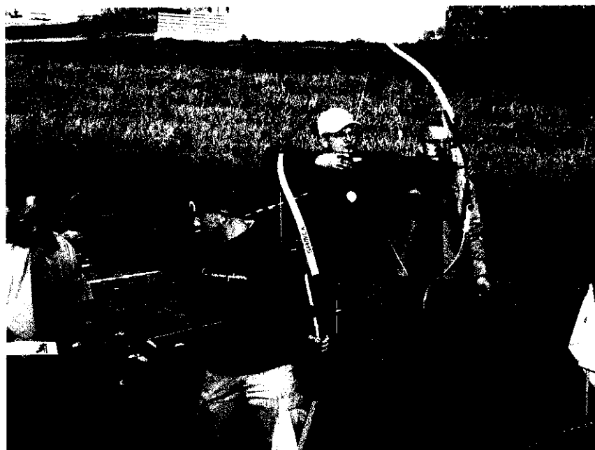
Fot. 11 Amatorska Sekcja łucznicza „Jastrząb” w Kurzętniku (2008)