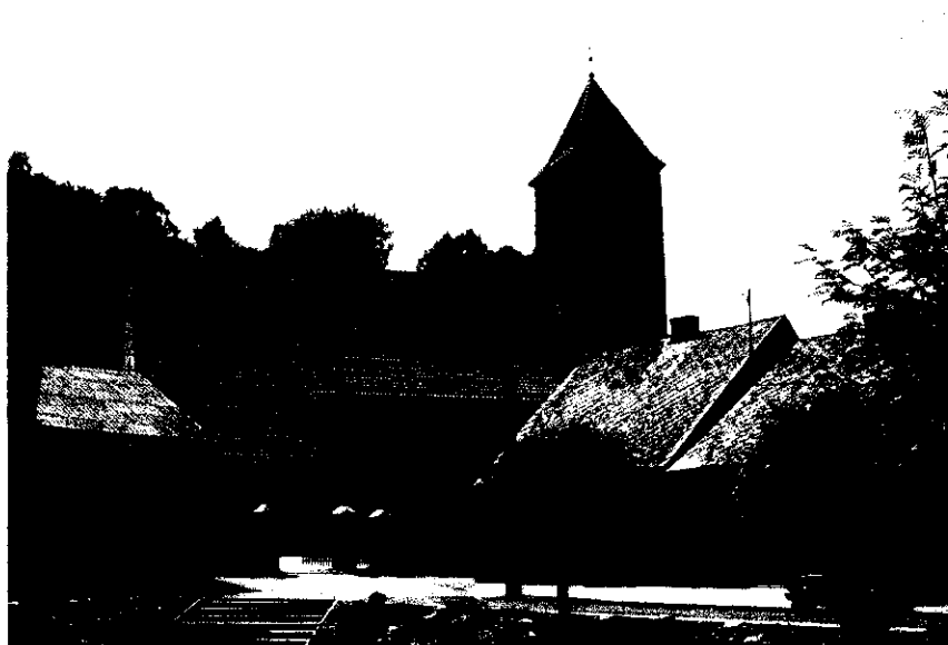
Fot. 3 Kościół parafialny w Kurzętniku

oraz następujące obiekty o wartości kulturowej: