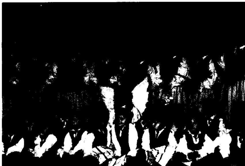
Fot. 6 Zespoły „ANIBABKI” oraz „KURCZACZKI” w czasie spotkania wigilijnego w 2008 r.

Klub Sportowy „ZAMEK Kurzętnik” został założony jako Ludowy Związek Sportowy „ZAMEK Kurzętnik” w 1992 r. Klub posiada sekcję piłki nożnej w A-klasie oraz drużynę, która 2005/2006 roku awansowała do IV ligi woj. warmińsko-mazurskiego. Sekcja piłki nożnej posiada również drużyny trampkarzy, młodzików oraz juniorów.